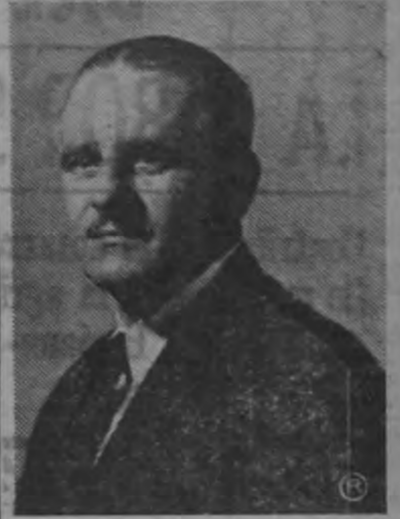
Sería la United negociando consigo misma...