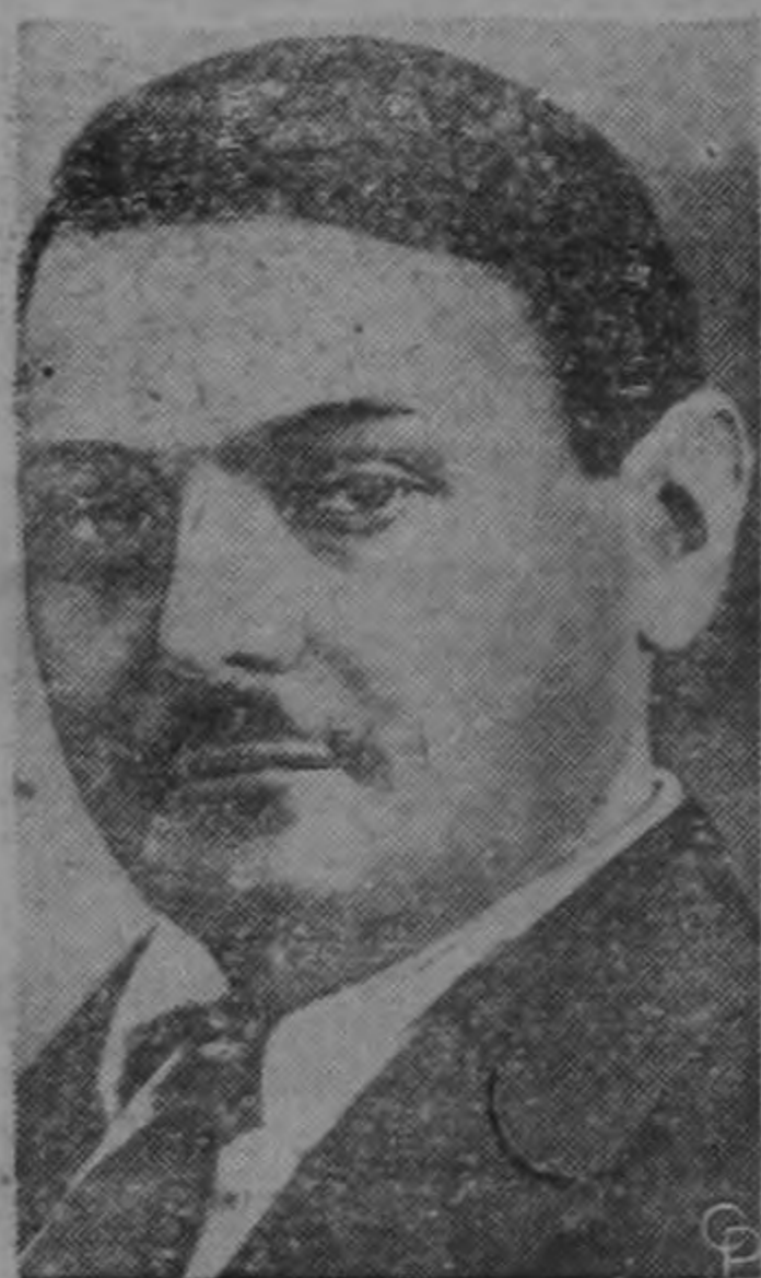
La muerte en 1948 del fundador del Cominform ruso Andrei S. Zhdanov (en la foto) está siendo usada por los propagandistas soviéticos como motivo para su campaña anti-semita. Según anuncios oficiales de Moscú "médicos terroristas judíos" fueron responsables por la muerte de altos funcionarios soviéticos, inclusive Zhdanov. Han sido condenados a muerte nueve médicos acusados de equivocarse en los diagnósticos y de aplicar tratamientos equivocados.