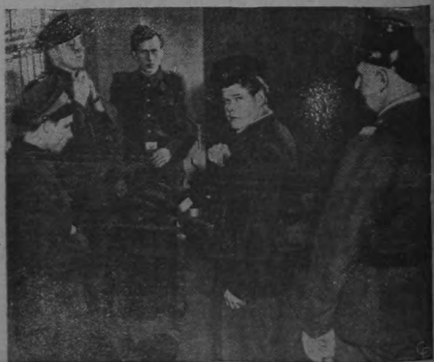
Un policía de la Alemania Occidental observa (a la derecha) a cuatro desertores de la policía comunista de la Alemania Oriental que rápidamente se desprenden de sus uniformes de estilo ruso después de buscar asilo en el Berlín Occidental. En esa forma los rojos han perdido 2.249 policías desde 1952.