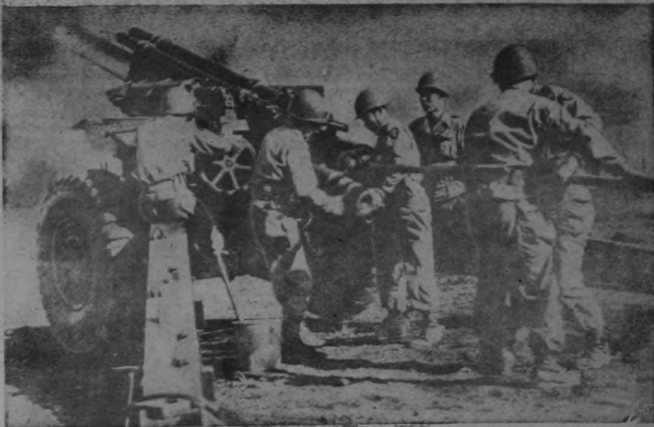
En maniobras, miembros del cuerpo de 110.000 hombres de Seguridad Nacional del Japón, manejan un howitzer de 105-mm. arrendado al Ejército Norteamericano. Esta es la primera vez que las fuerzas armadas japonesas han manejado equipos pesados, inclusive tanques, artillería y aviones, desde su rendición en 1945.