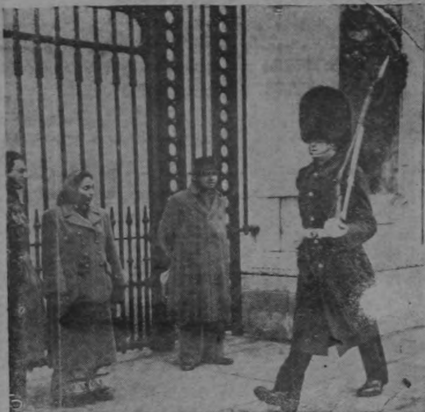
Un granadero del Segundo Batallón monta guardia frente a las puertas del Palacio de Buckingham, en Londres. Esa es la primera vez desde 1939 — una ausencia record que el batallón ha montado guardia en ese lugar tradicional. Con solo una breve interrupción los granaderos han estado en ultramar desde 1939.